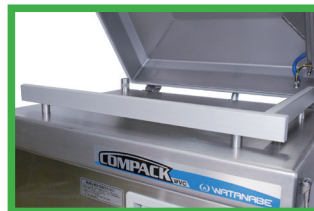
WVC-P400LH ハイカウンターバー